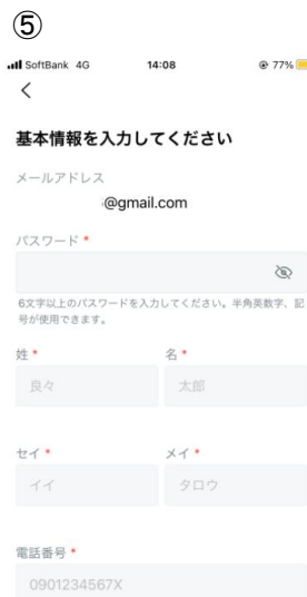
好きなパスワードを設定 情報入力