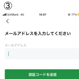
希望のメールアドレス宛に招待コードを送付します