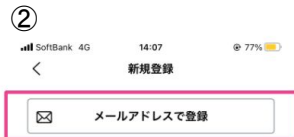
メールアドレスで登録を選択