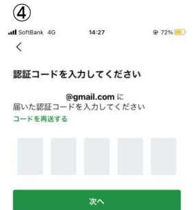
共有された招待コードを入力