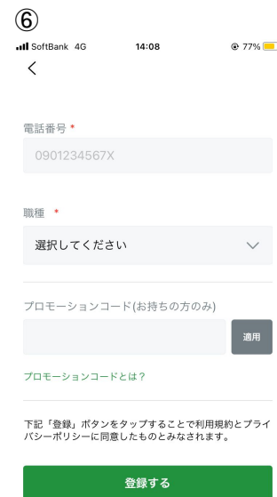
情報を入力したら 登録するを押す