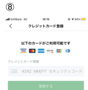
クレジットカード情報を 登録