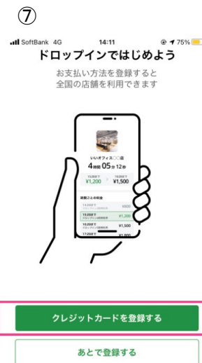
クレジットカードを登録する を選択