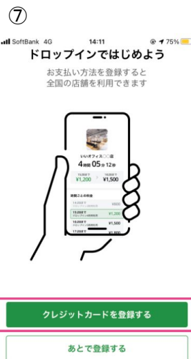
クレジットカードを登録する を選択